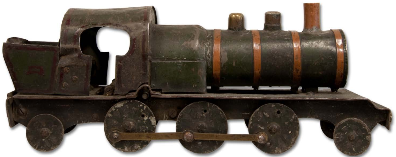
La locomotive de Marcel , de type 131 TB, modèle au 1/87e, années 1930-40

Réalisée à partir de matériaux de récupération