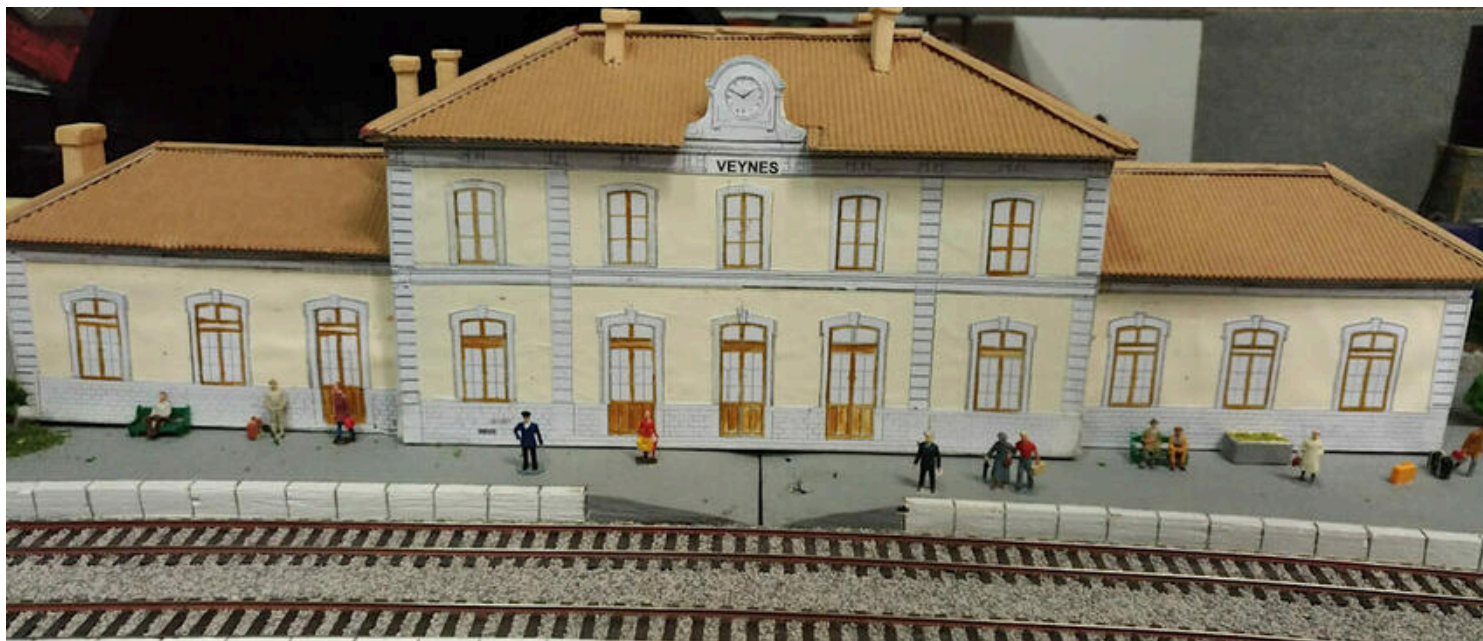
Gare de Veynes