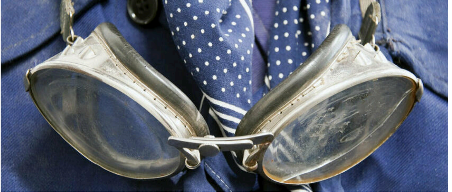
lunettes de mécano