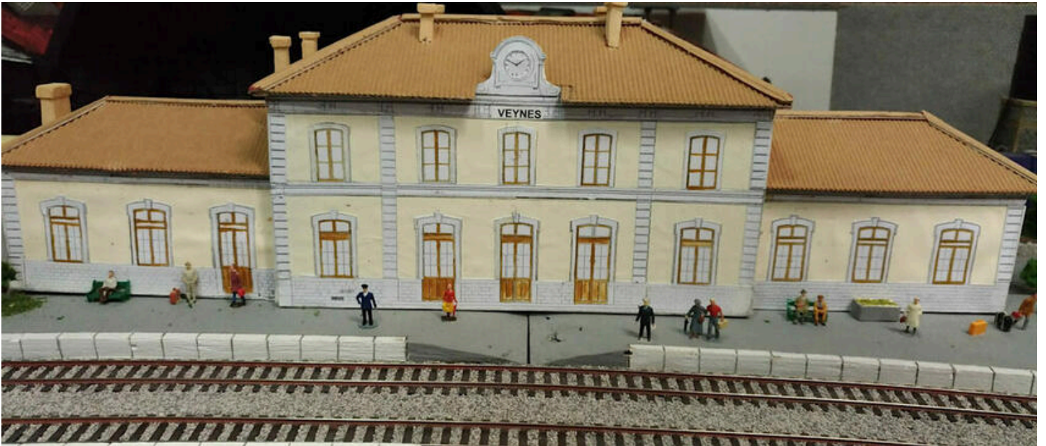
Gare de Veynes