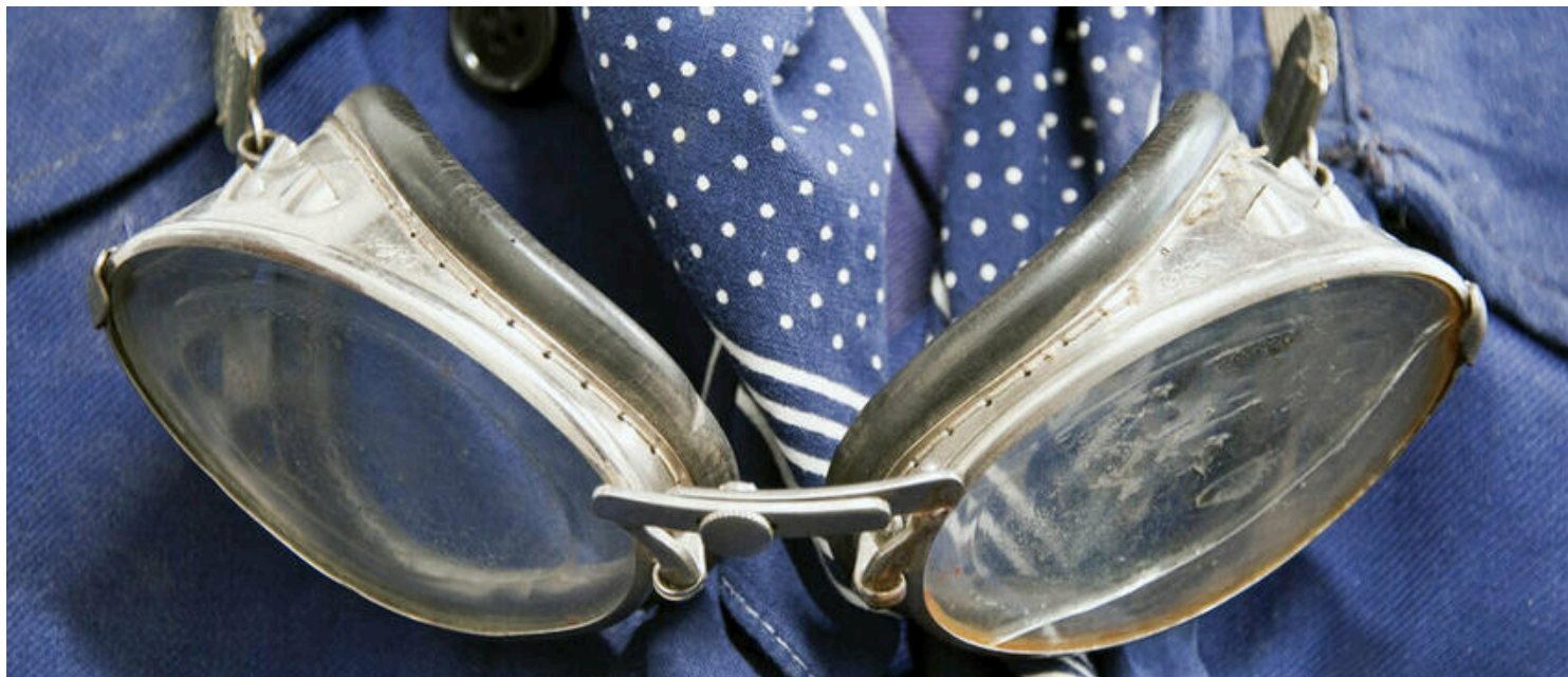
lunettes de mécano