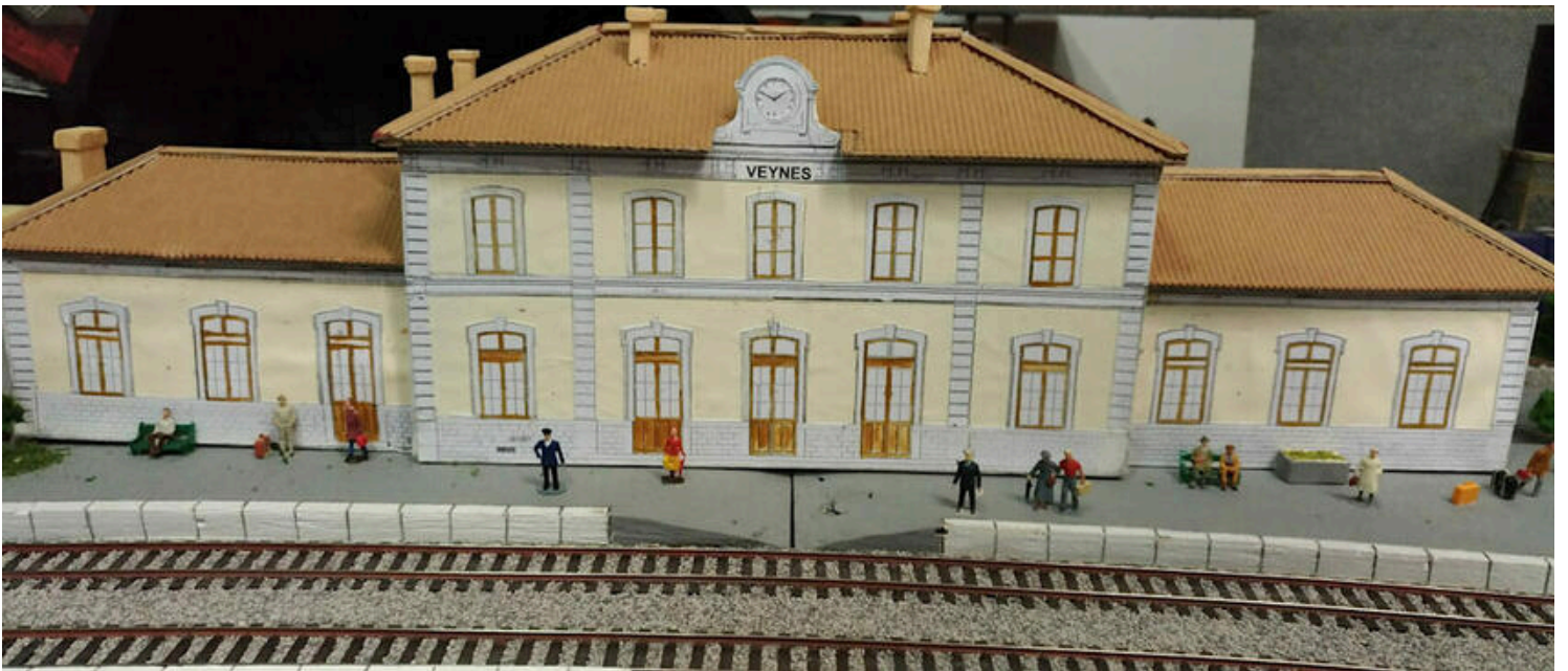
Gare de Veynes