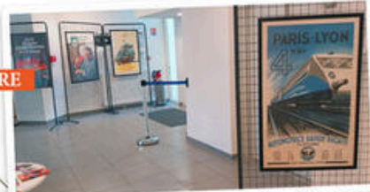
La Méretièrre (Veynes)

« Plus vite ! plus vite ! » Les tractions gagnent de la vitesse. Des records d'années en années. Arriver avant de partir : avec le train tout est possible !