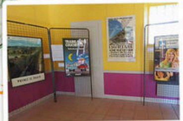
La Mairie Furmeyer

« Le bonheur en train » Prenez le train ... Prenons le train ... Des Pyrénées jusqu'à la Provence, sur la côte comme dans l'arrière-pays où le dépaysement est à portée de voie.