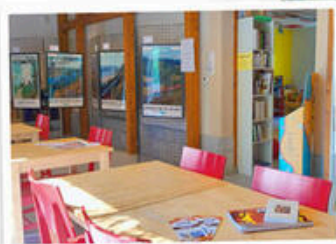
Médiathèque La Faurie

« En peinture comme en photo » Les années soixante et des départs en vacances de plus en plus nombreux, grâce aux congés payés, mais aussi au train ... Que de sujets pour des peintres et des photographes inspirés !