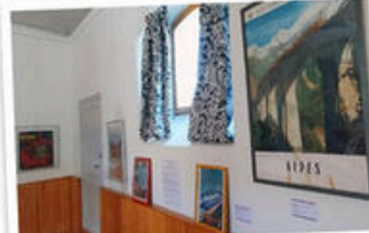
Mairie (école) Le Saix